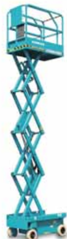
■ 屋外保管・一点吊り対応型高所作業車